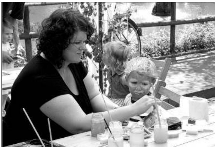
Kinder – die Zukunft unseres Dorfes – kamen beim 6.Fukuhlenfest am zweiten Tag voll auf ihre Kosten.