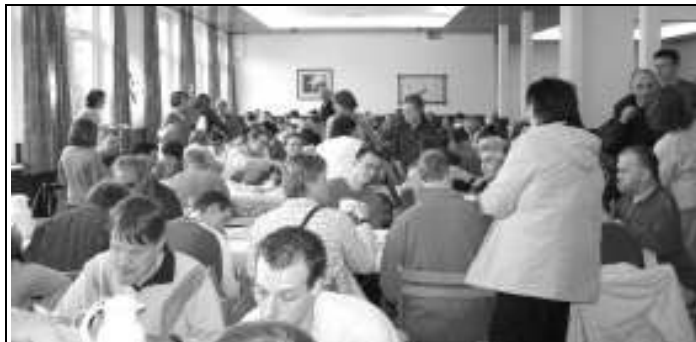
Fest der Begegnung 2006 : Traditionell geht es im BT mit einem gemeinsamen Kaffeetrinken los.

Bitte tragen Sie sich deshalb rechtzeitig in die bekannten Listen ein.