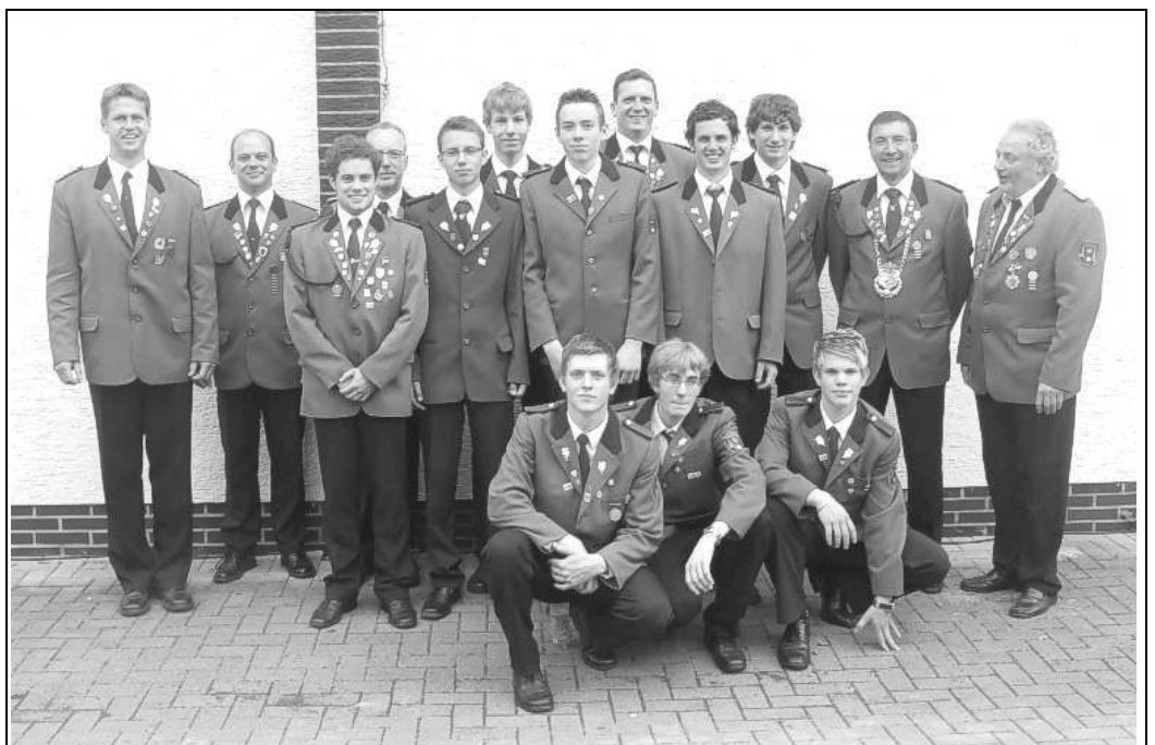
Kreisjungschützentag 2008: Die Delegation aus Dedinghausen

Anschließend traf man sich in der Schützenhalle, um mit anderen Vereinen und Schützen Erfahrungen und Gedanken auszutauschen. Der gesellige Teil kam natürlich nicht zu kurz.