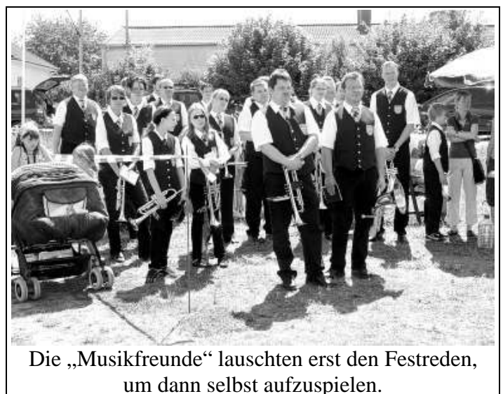
Die „Musikfreunde“ lauschten erst den Festreden, um dann selbst aufzuspielen.