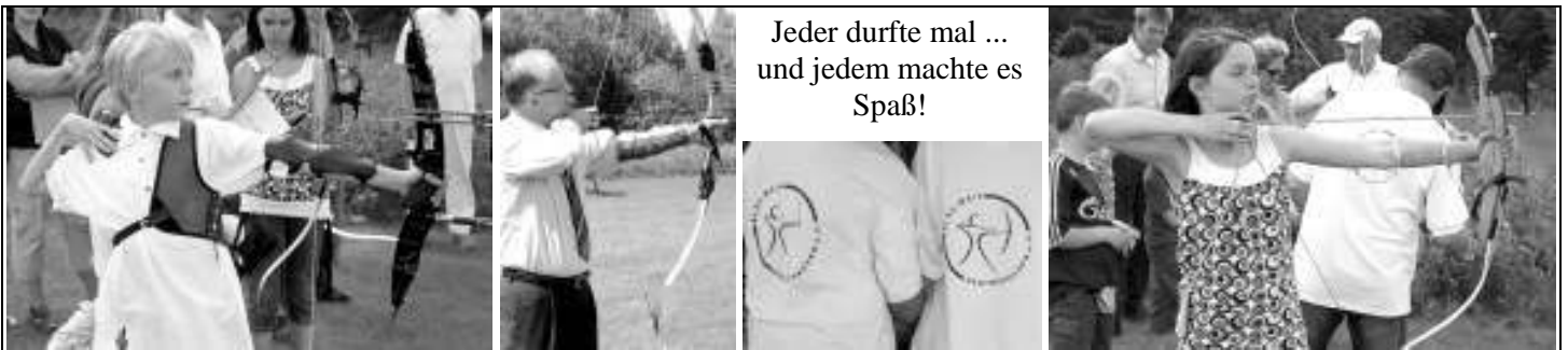
Jeder durfte mal ... und jedem machte es Spaß!

Für den Hauptvorstand wünsche ich der Bogensportabteilung für die Zukunft viele zufriedene Mitglieder, viel Spaß auf diesem Gelände und einen erfolgreichen Schießbetrieb, den einzelnen Schützen ein klares Auge und einen ruhigen und starken Arm und uns Allen ein harmonisches Miteinander innerhalb der Blau-Weißen Familie.