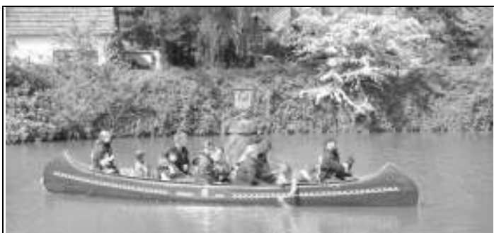
Fest der Begegnung 2006 : Eine Kanufahrt auf der Fukuhle kommt nicht nur bei den Gästen gut an.