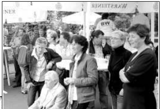
Auch den Zuschauern machte das Kicker-Turnier Spaß

Tja, so ist das: nach dem Spiel ist vor dem Spiel. Das Schießen auf die Torwand scheint mir bei allen acht Teams