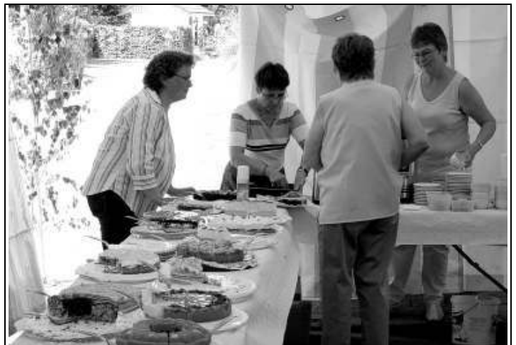
Kaffee, Kuchen, Plausch – ein feiner Sonntag