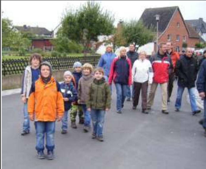
Zunächst gemeinsam und ab dem Bahnhofsteppunkt getrennt, die großen und kleinen Schnadgänger.

Wie bereits in den vergangenen Jahren, so hatte auch dieses mal die Kolpinggruppe „Junge Familien“ eine eigene Route zum Schnadgang angeboten.