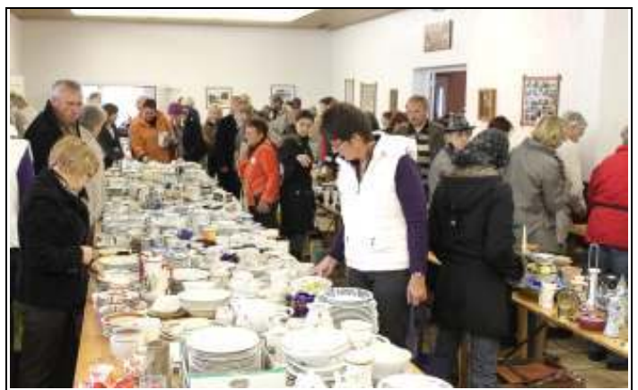
Dinnen wie draußen – es war viel los.

fand der Basar zur Unterstützung verschiedener Hilfsprojekte am letzten Sonntag des Monats statt. Aufgrund des hohen Aufwands, der mit der Durchführung einer solchen Veranstaltung verbunden und dabei in den vergangenen Jahren stetig gestiegen ist, hatten sich die Organisatoren entschieden, nach dem Trödelmarkt 2009 diesen in der jetzigen Form einzustellen. Welche Möglichkeiten in der Zukunft gefunden werden, mit denen sich der Eine-Welt-