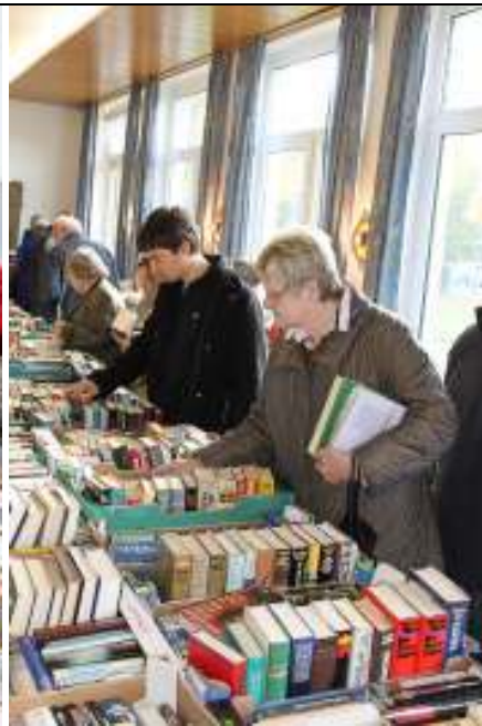
Bücher –soweit das Auge reicht

Anziehungskraft des Marktes weit über Dedinghausens Grenzen hinaus. Wie es sich für einen Basar gehört, wurde bei der Preisfindung häufig auch kräftig gefeilscht, so dass einige Schnäppchen gemacht werden konnten. So war es nicht verwunderlich, dass schon wenige Minuten, nachdem das große Stöbern freigegeben worden war, die ersten Kisten und Tüten in den Autos verstaut wurden. Viele fleißige HelferInnen, ob als VerkäuferInnen an den Ständen, in der Küche, an den Waffeleisen, am Würstchenstand oder wo auch immer, sorgten dabei für einen reibungslosen Ablauf.