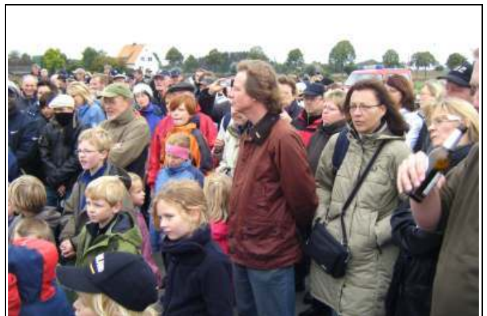
Treffen am neuen Grenzstein