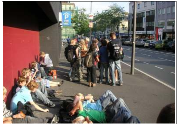
Ausflug in die Stadt

Angesteckt durch das Krimifieber fand sich dann noch schließlich eine Gruppe von Kindern, die einen eigenen Kica Film drehten, in dem es um die Überführung einer kleinen Gruppe von „Bösewichten“ ging, die