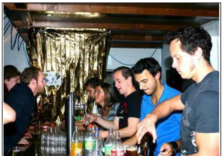
Das Thekenteam hatte ordentlich zu tun beim 4.Rocktoberfest im Bürgertreff.

Leitung des Sportvereins Blau-Weiß und Bewirtung der 2. Mannschaft eine zünftige Party.