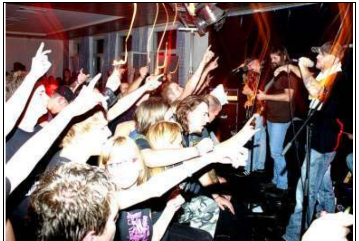
Super Stimmung im Bürgertreff

Nach kurzer Umbauphase erklommen die Backflips die Bühne. Die Top40 Band präsentierte vor allem Titel des aus Funk und Fernsehen bekannten Mainstreams, so dass gerade die Gitarrenlast ein wenig in den Hintergrund trat. Von Silbermond über Lady Gaga bis hin zu Bon Jovi reichte hier das Repertoire der Bielefelder und Lippstädter Partyband, die mit großem Applaus bedacht wurde. Zum Ende des Abends wurden die Klänge dann nochmals ein wenig härter. Die Böhse Onkels Coverband Domamin Inc. brachte unter tosenden Schlachtrufen den Bürgertreff zum Beben. Die Lippstädter legten einen ekstatischen Auftritt hin und