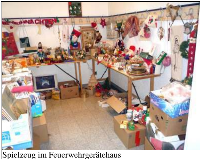
Spielzeug im Feuerwehrgerätehaus

Anziehungskraft des Marktes weit über Dedinghausens Grenzen hinaus. Wie es sich für einen Basar gehört, wurde bei der Preisfindung häufig auch kräftig gefeilscht, so dass einige Schnäppchen gemacht werden konnten. So war es nicht verwunderlich, dass schon wenige Minuten, nachdem das große Stöbern freigegeben worden war, die ersten Kisten und Tüten in den Autos verstaut wurden. Viele fleißige HelferInnen, ob als VerkäuferInnen an den Ständen, in der Küche, an den Waffeleisen, am Würstchenstand oder wo auch immer, sorgten dabei für einen reibungslosen Ablauf.