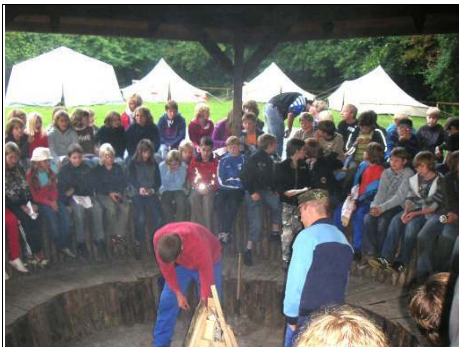
Warten auf's Lagerfeuer