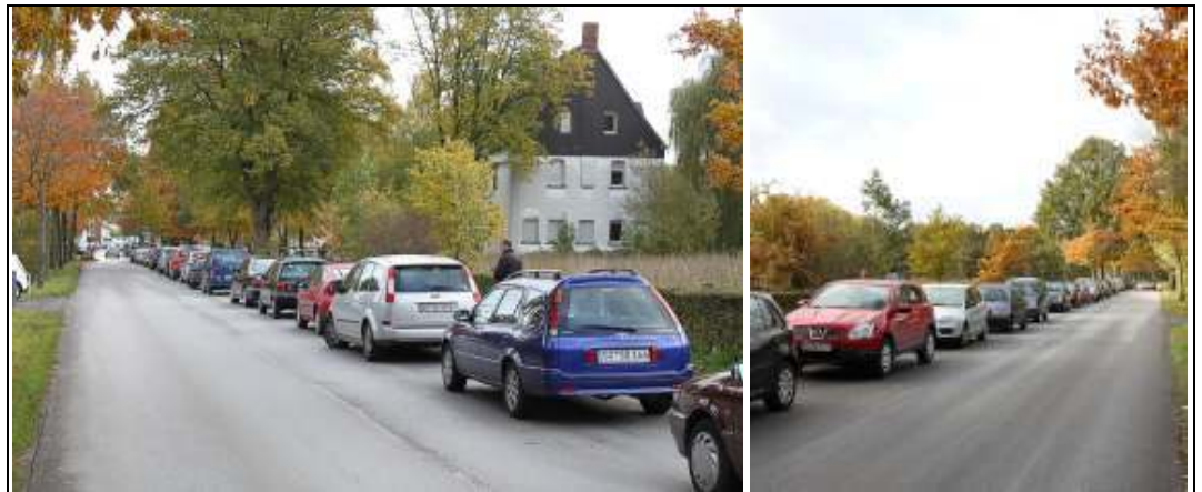
Zugeparkte Straßen in Dedinghausen – es ist Trödelmarkt!

(GW) Es ist ein Sonntag im Oktober und in Dedinghausen herrscht seit dem frühen Morgen ein Verkehrschaos - ein untrügliches Zeichen dafür, dass der D-E-R Eine-Welt-Kreis seinen jährlichen Trödelmarkt im und am Bürgertreff veranstaltet. Auch in diesem Jahr war es wieder soweit. Zum letzten Mal