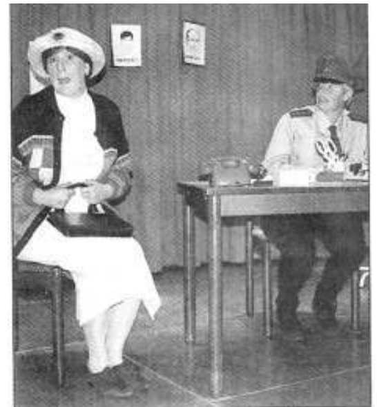
Dieser Sketch über einen vermissten Ehemann war nur einer von vielen, die bei der Jahreshauptversammlung der kfd der Pfarrei Esbeck aufgeführt wurden.