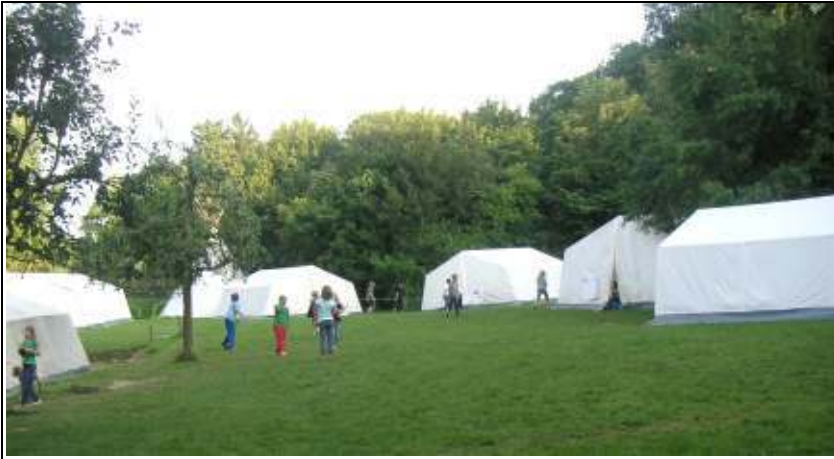
Zeltplatz nahe Bad Godesberg

Recht kriminalistisch ging es in dem Kindercamp 2009 in der Zeit vom 1. – 12. August zu. Gleich drei knifflige Kriminalfälle hatten unsere Kinder zu lösen. Beim Bergfest, also genau zu der Halbzeit der Ferientage, durften die Kinder in die Rollen der TKKG Hauptpersonen schlüpfen, um durch das Lösen verschiedener Stationsaufgaben wertvolle Indizien zu sammeln, die zur Überführung des Täters gebraucht wurden. Mit großem Eifer machten sich unsere jungen Kommissare an die Arbeit und konnten mit einer Aufklärungsquote überzeugen, die unsere Kriminalpolizei nur neidisch machen kann: alle Gruppen fanden unter etlichen Verdächtigen den wirklichen Täter heraus.