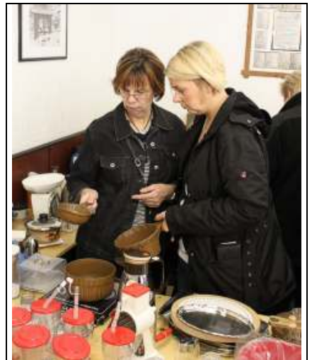
Auch beim Trödelkauf geht's kritisch zu.

von der ehrenamtlichen Arbeit des Eine-Welt-Kreises. Denn der Erlös des letzten Trödelmarktes ist wie in den Vorjahren für die Unterstützung ihrer Arbeit bestimmt. In Lippstadt wird KIA (Keiner ist allein) ebenso unterstützt wie die Hausaufgabenhilfe des Sozialdienstes ka-