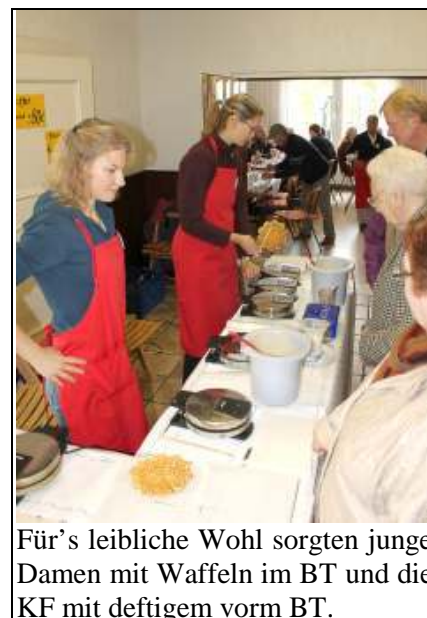
Für's leibliche Wohl sorgten junge Damen mit Waffeln im BT und die KF mit deftigem vorm BT.

tholischer Frauen (SKF). Für eine Kfz-Ausbildungswerkstatt mit derzeit 20 Auszubildenden, eine Schule für Körperbehinderte sowie für Mädchen- und Frauenbildung fließen Teile des Erlöses nach Ghana. Und